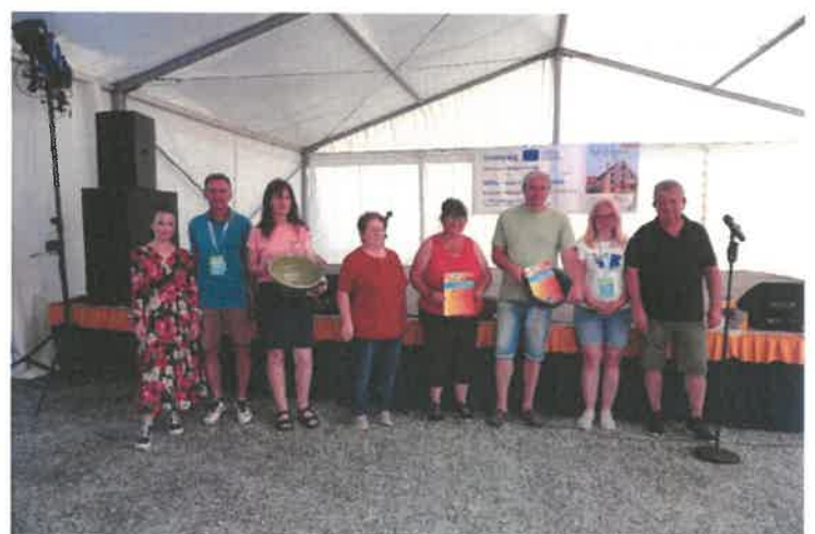
Fotók: rajz és alkotói verseny, malom-játék és kenyérsütő verseny eredményhirdetés

A program sikeres megvalósításához külső szakmai szolgáltatókat, valamint számos önkéntest vontunk be. Minden egyes területnek megfelelő kompetenciákkal bíró szakmai felelőse, animátora volt, hogy minél szakszerűbben és gördülékenyebben tudjuk szolgálni az ide érkező látogatókat. A program a tervezett és vállalt célokat maradéktalanul megvalósította, és jelentős mértékben gyarapította a partnerek, különösen a szlovén és magyar nemzett közt fennálló kiemelkedően jó együttműködést, kulturális és szakmai kapcsolatot. Az általunk szervezett programon szlovén partnereink is szép számmal képviseltették magukat, bekapcsolódva az egyes programelemekbe is.