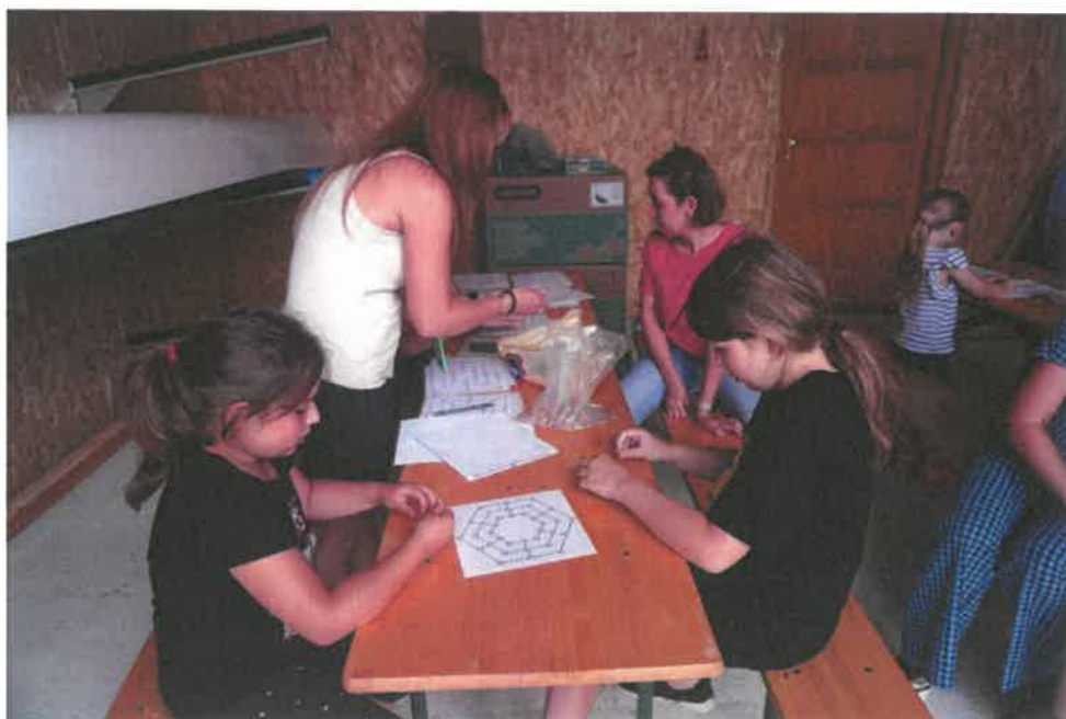
Fotók: malom társasjáték

A projekt egyik meghatározó célcsoportja a felnövekvő generáció, az iskolás gyermekek voltak. Az ő tekintetükben a malmok – ezen belül kiemelten a csörötneki malom – egykori jelentőségét, a történelmi időkben betöltött fontosságára hívtuk fel a figyelmet kötetlen, játékos formában. Számukra rajzversenyt, a vízimalmok működését bemutató foglalkozást, és malomjátékot szerveztünk szakképzett pedagógusok, animátorok részvételével. Fialat generáció fogékonyságát mutatja az elkészült kreatív alkotások szép száma és a programokon történő aktív részvétel.