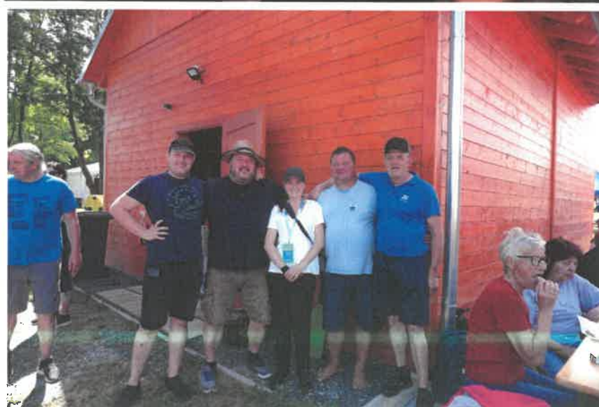
Fotók: szlovén partnereink Csörötneken