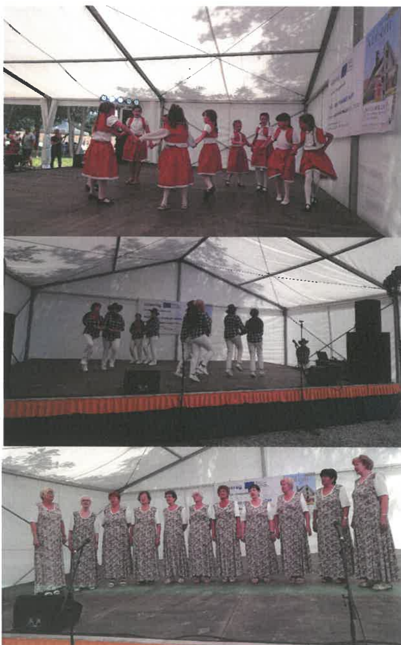
Fotók: 1. kulturális blokk (rendezvénysátor)

A rendezvény programjain a térségi civil szervezetek képviselői is részt vettek, színesítve a nagy tömegeket vonzó fellépőket is magába foglaló kulturális, szórakoztató programot. A szakmai program mellett (petíciós kiadvány bemutatása és hozzá kapcsolódó kerekasztal-beszélgetés) és a gasztronómiai élményeken túl, gazdag kulturális és sokszínű, színvonalas szórakoztató programok tették teljessé a kilátogató nagyszámú érdeklődő, résztvevő napját. A kulturális programokat 7 fellépő-csoport, együttes gazdagította.