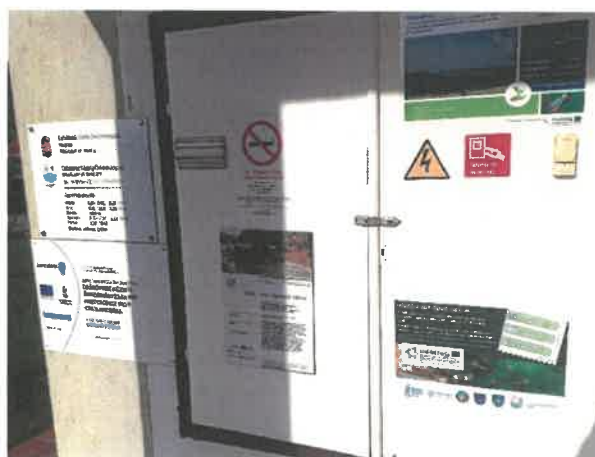
Projektábra a kedvezményezett székhelyén

A sikeres rendezvénnyel és projekttel a jövő elkezdődött, azaz tovább erősödött az eddigiekben is kiegyensúlyozott és gyümölcsöző kapcsolat a projektpartnerek, valamint a két nemzet lakosai között, erősítve ezzel a szlovén-magyar határtérség jövőbeni együttműködési lehetőségeit a gazdaság, a kultúra, az oktatás terén.