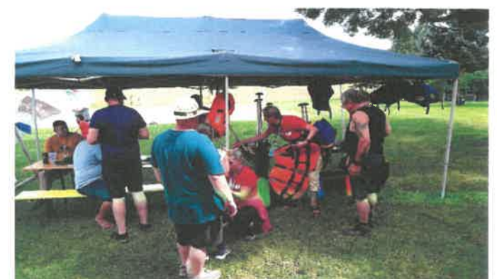
Szlovén partnerek standjai