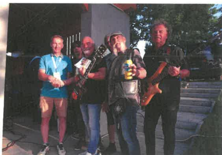
Fotók: a malom megmentésére irányuló petíció bejelentése és a petíciós kiadvány átadása a prominens fellépőknek