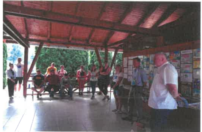
Fotó: petíciós kiadvány bemutató, kerekasztal-beszélgetés, fórum

A malmok és a malomipari tevékenység, valamint a feldolgozott malomipari termékek népszerűsítését szolgáló gazdag programkínálattal bíró Malmok - közös értékeink rendezvényt sikeresen megrendeztük 2024. június 22-én. A rendezvényt nagyszabású előkészítő munka előzte meg, valamint széles körű marketingkampány népszerűsítette azt.