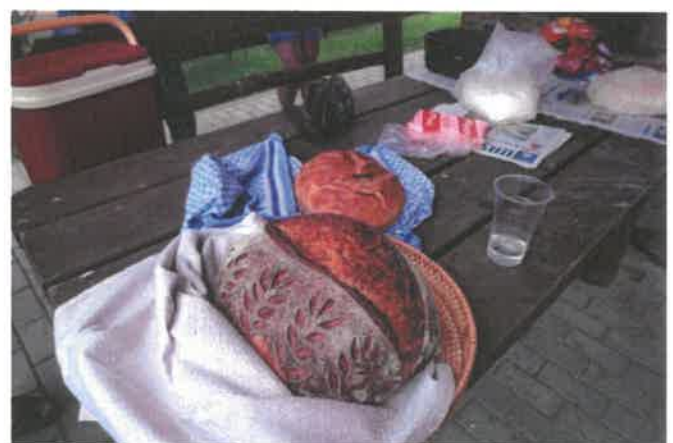
Fotók: kenyérsütő verseny

A projekt célcsoportjai között meghatározásra kerültek azon érdekképviselői és civil szervezetek, akik a projekt megvalósításában aktívan részt vettek a határ két oldalán. A projekt eredményei és sikeres programok hozzájárultak e szervezetek társadalmi elismertségének, helyi közösségek életében betöltött meghatározó szerepének növeléséhez, megerősödéséhez. A projekt stabilan megerősítette a projektben résztvevő szervezetek közti együttműködést, mely a jövőre nézve több közös program megvalósítását vetíti elő, növelve ezzel a határtérség szlovén és magyar lakosságának egymás iránti kölcsönös tiszteletét, elfogadását és közös célok iránti együttműködését.