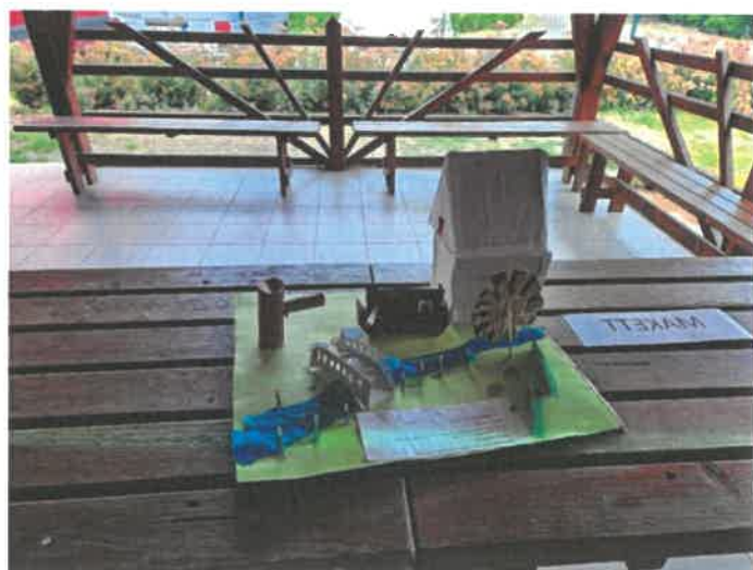
Fotó: alkotói kiállítás (3D-s makettek)