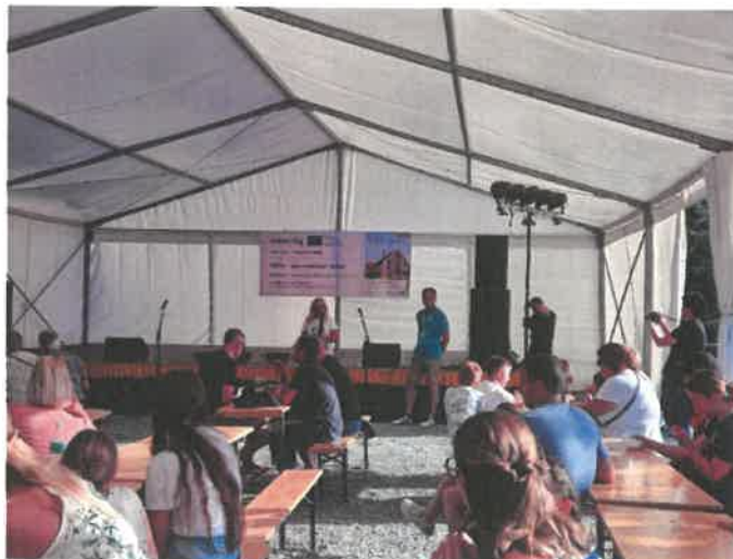
Fotó: megnyitó (rendezvénysátor)

A malmok és a malomipari tevékenység, valamint a feldolgozott malomipari termékek népszerűsítését szolgáló gazdag programkínálattal bíró Malmok - közös értékeink rendezvényt sikeresen megrendeztük 2024. június 22-én. A rendezvényt nagyszabású előkészítő munka előzte meg, valamint széles körű marketingkampány népszerűsítette azt.