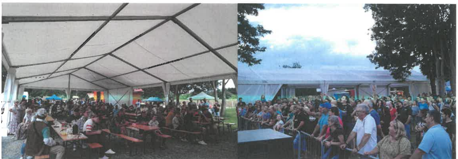
Fotók: nagyszámú résztvevők

A csörötneki rendezvényen a becsült látogatók száma meghaladta az 500 főt, melyből a csatolt jelenléti ív alapján 416 fő részvétele igazolt. A kerekasztal-beszélgetésen, valamint a petíciós kiadvány bemutatóján is szép számmal vettek részt (jelenléti ív alapján 59 fő).