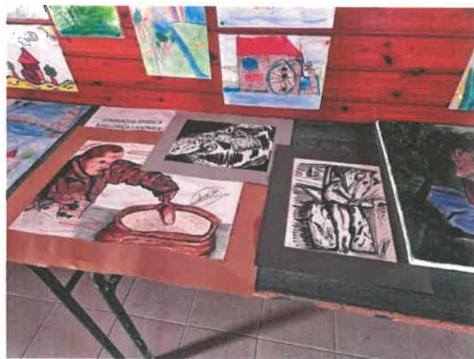
Fotók: alkotói kiállítás (rajzok, grafikák)