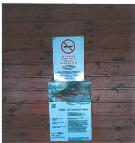
Projektábra a rendezvény helyszínén